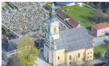
PFARRKIRCHE WIES Renovierung Turmdach