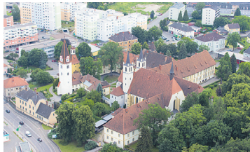
PFARRKIRCHE LOEBEN-GÖSS Renovierung Michaelskapelle