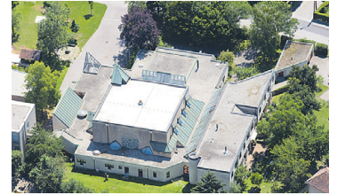
PFARRKIRCHE GRAZ-SALVATOR Teilweise Erneuerung Dach, Renovierung Fassade