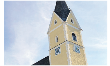
PFARRKIRCHE BAD MITTERNDORF Renovierung Turmfassade