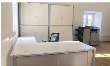
PFARRKANZLEI/PASTORALRAUM ST. JOHANN/SAGGAUTAL Renovierung, Erneuerung Fenster