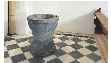
PFARRKIRCHE NOREIA Innenrenovierung