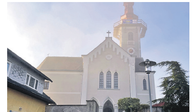
PFARRKIRCHE ST. OSWALD / PLANKENWARTH Neudeckung Turmdach