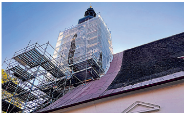
PFARRKIRCHE PIBER Renovierung Kirchturm