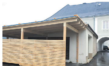
PFARRHOF BIRKFELD Errichtung 2. Wohneinheit im Pfarrhof