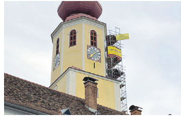
PFARRKIRCHE ANGER BEI WEIZ Renovierung Nordfassade Turm und Kirchenschiff