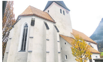
PFARRKIRCHE NIEDERWÖLZ Fassadenrenovierung, Neudeckung Dach