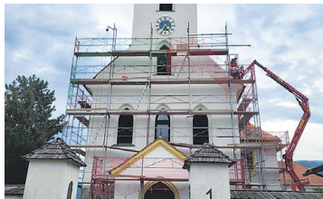
PFARRKIRCHE ST. LORENZEN / KNITTELFELD Außenrenovierung