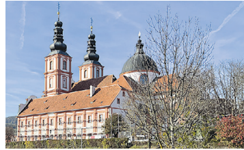
BASILIKA GRAZ-MARIATROST Renovierung Klostertrakte Süd, Nord und Ost, Rumpoldhaus