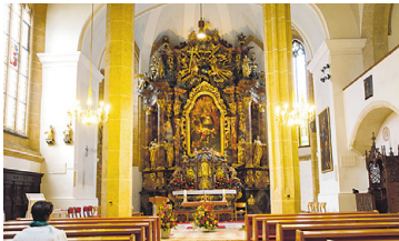
PFARRKIRCHE GRÖBMING Fenster Abschnitt 1