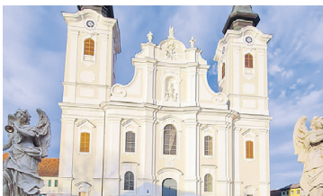
PFARRKIRCHE ST. VEIT / VOGAU Außenrenovierung und Umdeckung Dach