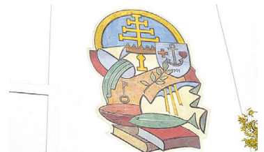
PFARRHOF GLEISDORF Renovierung und Umbau