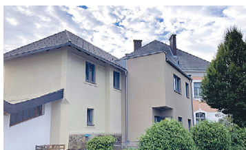
ST. KATHREIN AM OFFENEGG Zu- und Umbau Pfarrheim