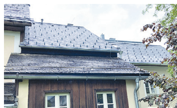
TAUPLITZ Dachsanierung Pfarrhof