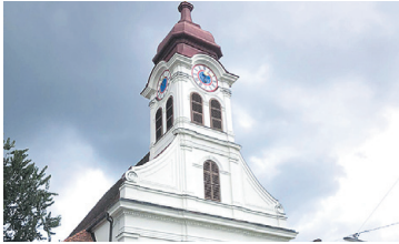
PFARRKIRCHE GRAZ-GRABEN Außenrenovierung Turm und Westfassade