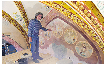
FILIALKIRCHE ST. MARTHA Renovierung