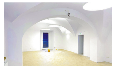
PFARRHOF TOBELBAD Renovierung Pastoralräume im Pfarrhof