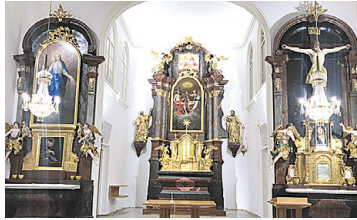
PFARRKIRCHE GRAZ-KARLAU Innenrenovierung